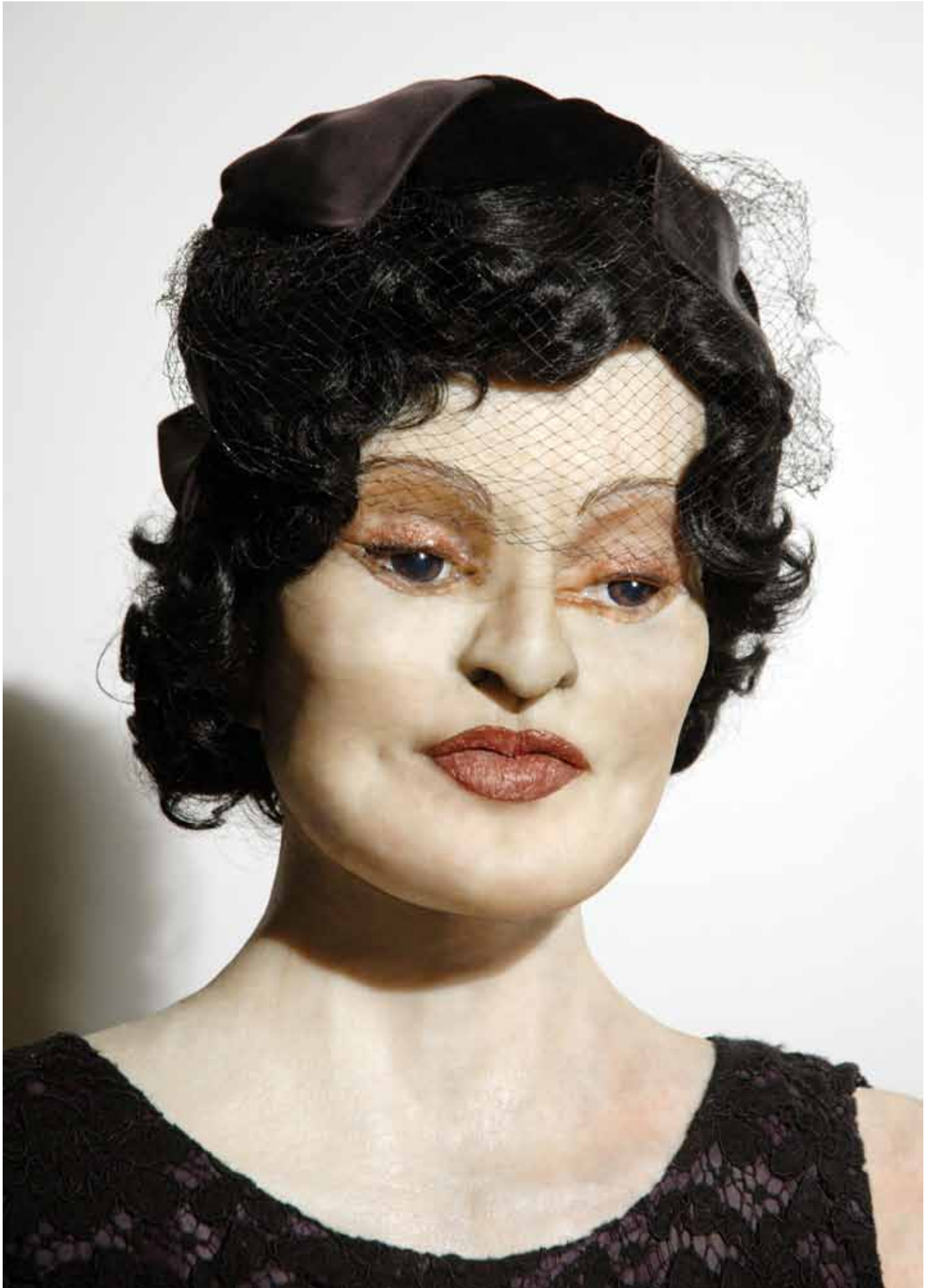
YLÄPUOLELLA | WEXLER, 200X VIEREISELLÄ SIVULLA | FLAG, 200X