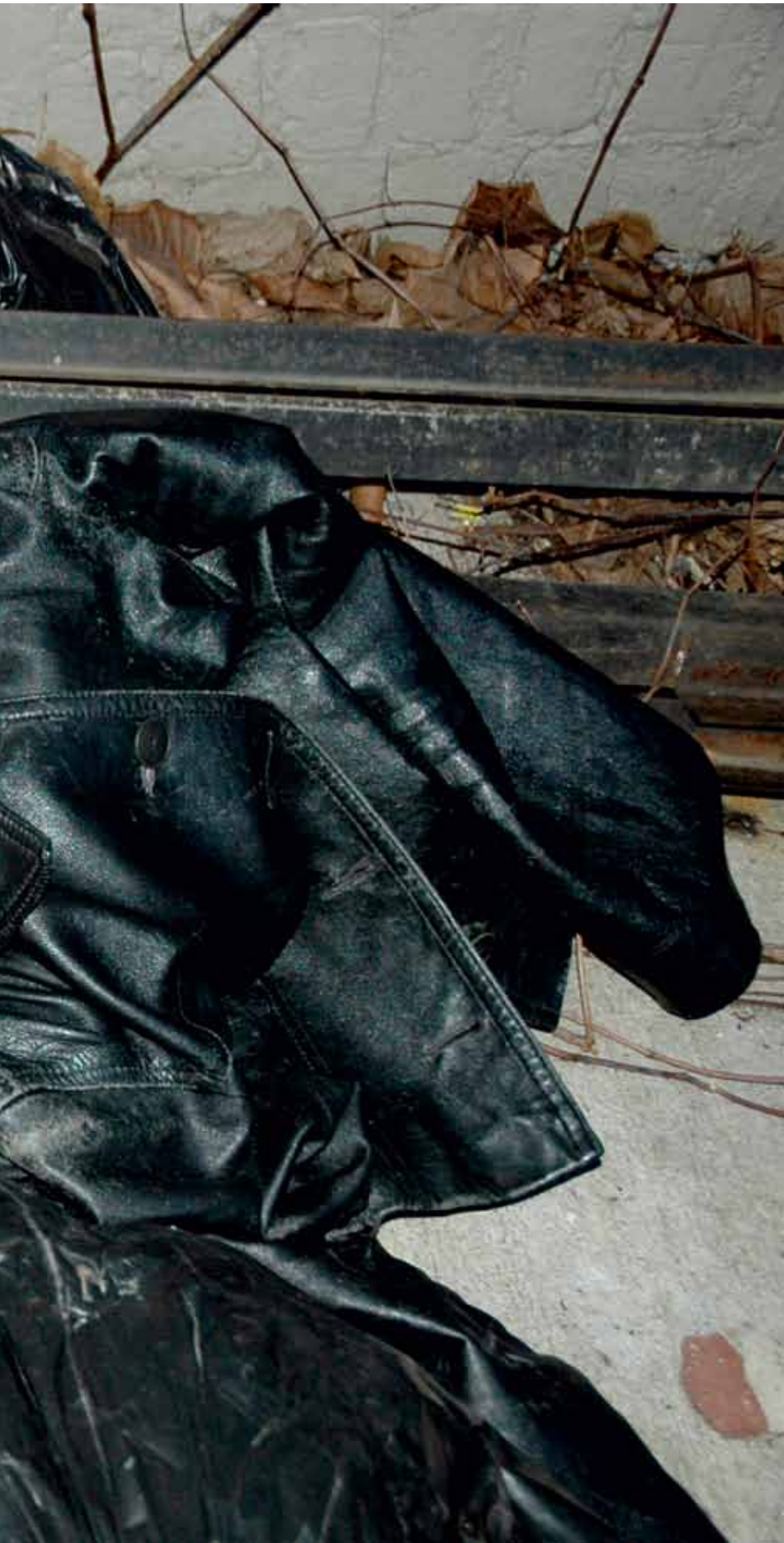
DEAD ?, 200X