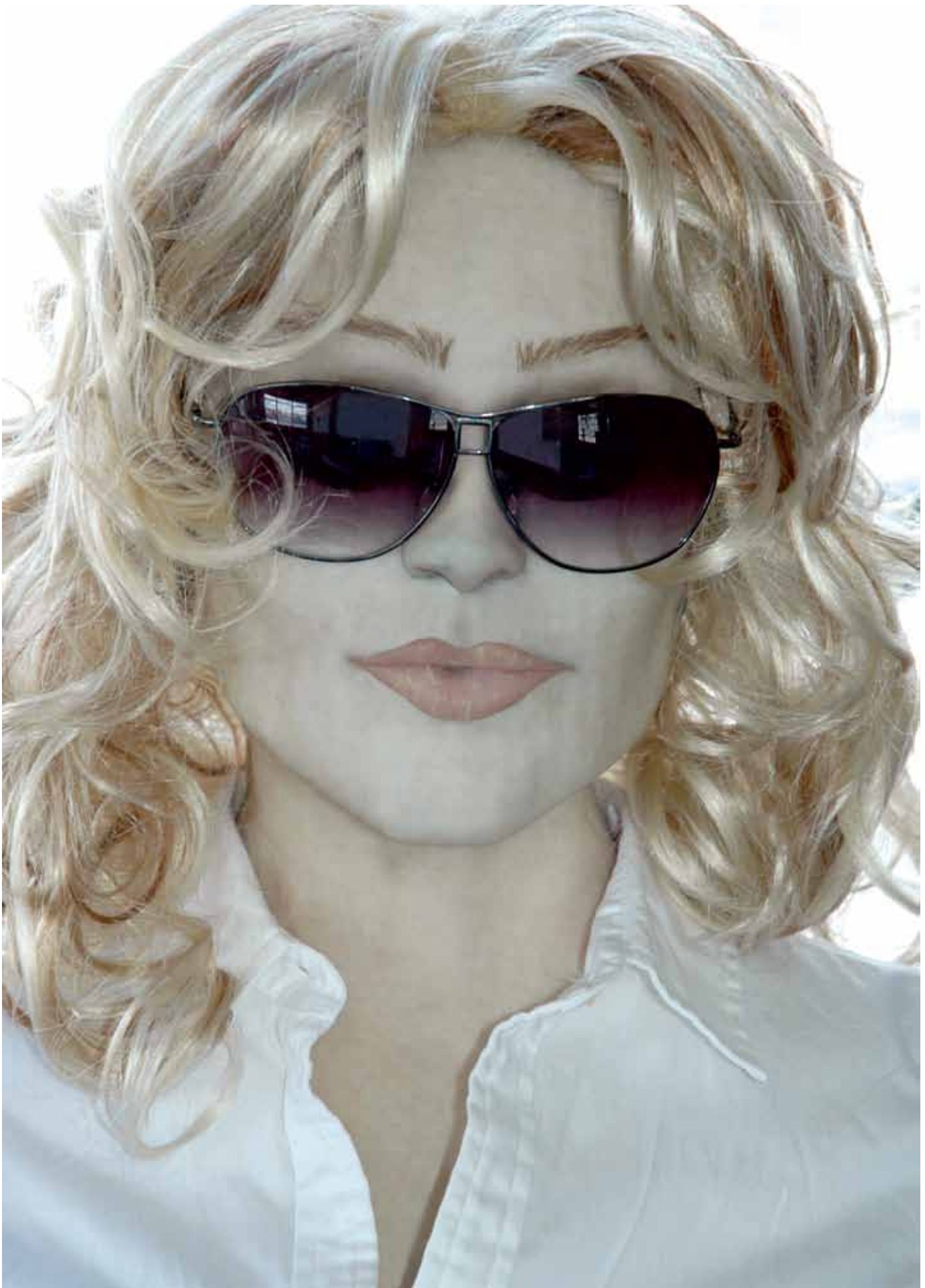
YLÄPUOLELLA | MILLET, 200X VIEREISELLÄ SIVULLA | DECAYED WOMAN, 200X EDELLEISELLÄ AUKEAMALLA | ALLEN, 200X