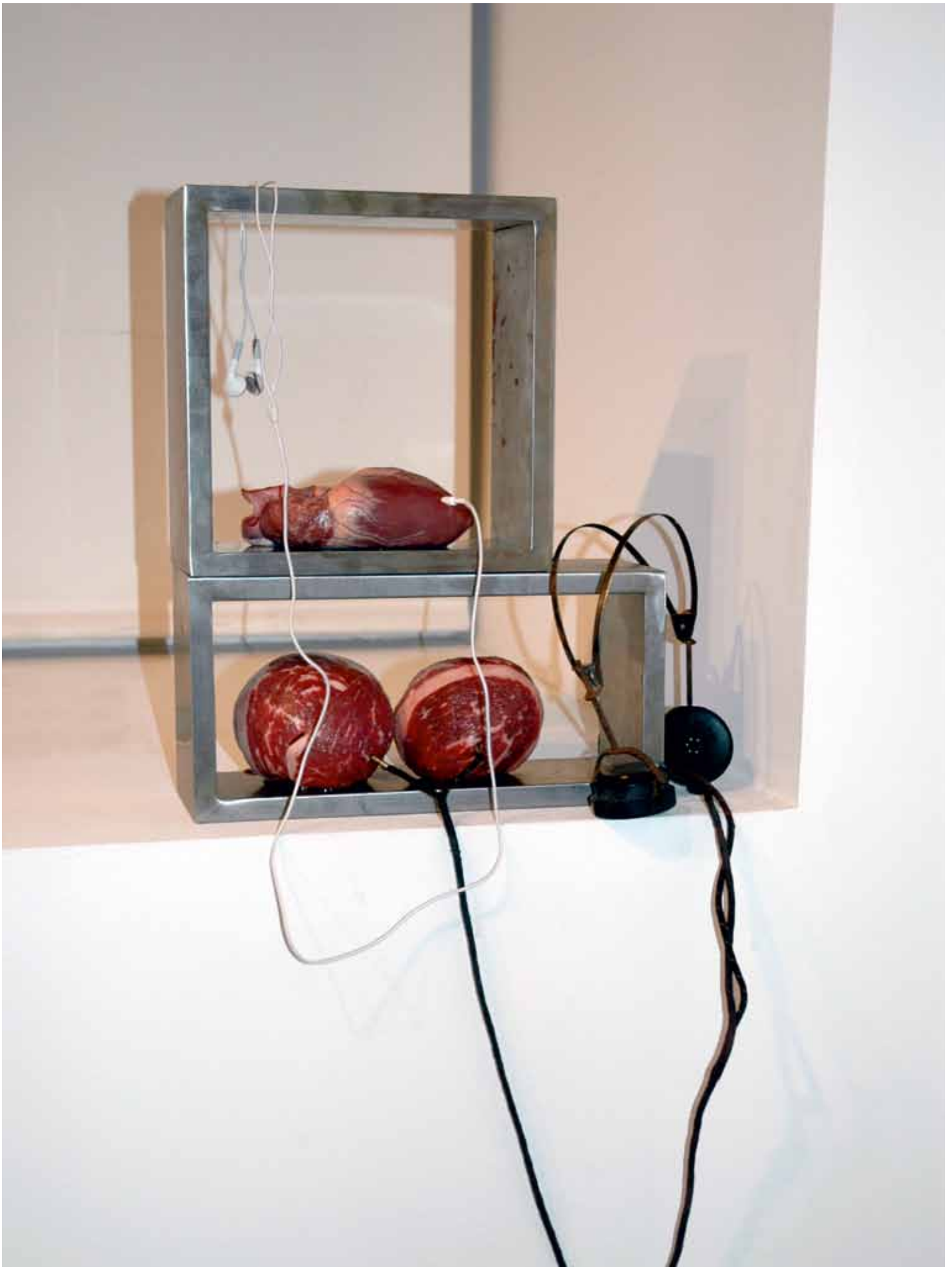
BETTY HIRST: UTOPIA, 200X